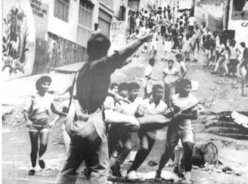
El Caracazo es considerado el día de La Rebelión Popular en Venezuela