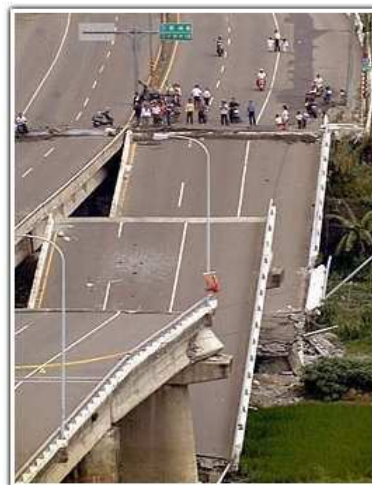
Grandes daños en Infraestructura - Chile

¿RECUERDAS CÓMO EMPIEZA ESTE ARTÍCULO? ... AHORA PRESTA ATENCIÓN