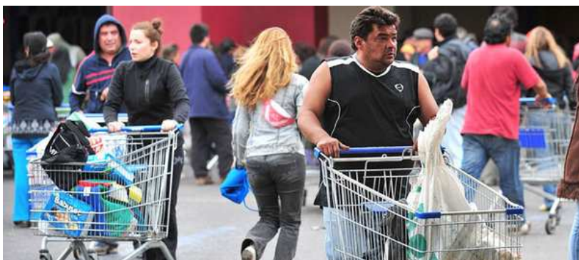
Chile – 2010 – Terremoto - Desesperación